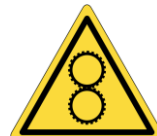
Ingranaggi in movimento