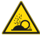
Proiezione di schegge e altri materiali

All'interno dell'area possono essere presenti, tra le altre, le seguenti fonti di rischio: