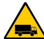
Mezzi in movimento